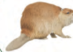
Eurázsiai hód Castor fiber